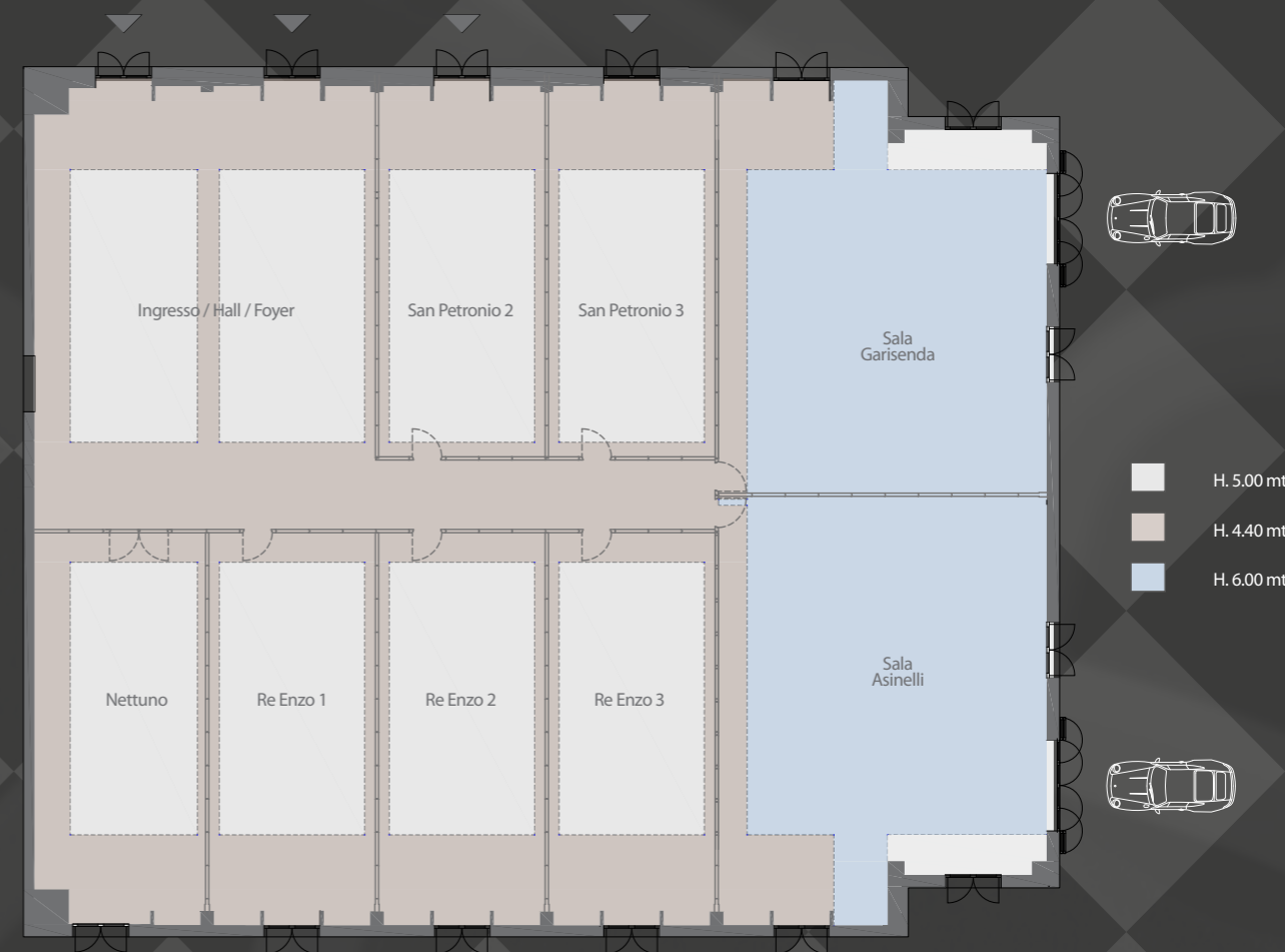
Tabella capienza / capacities