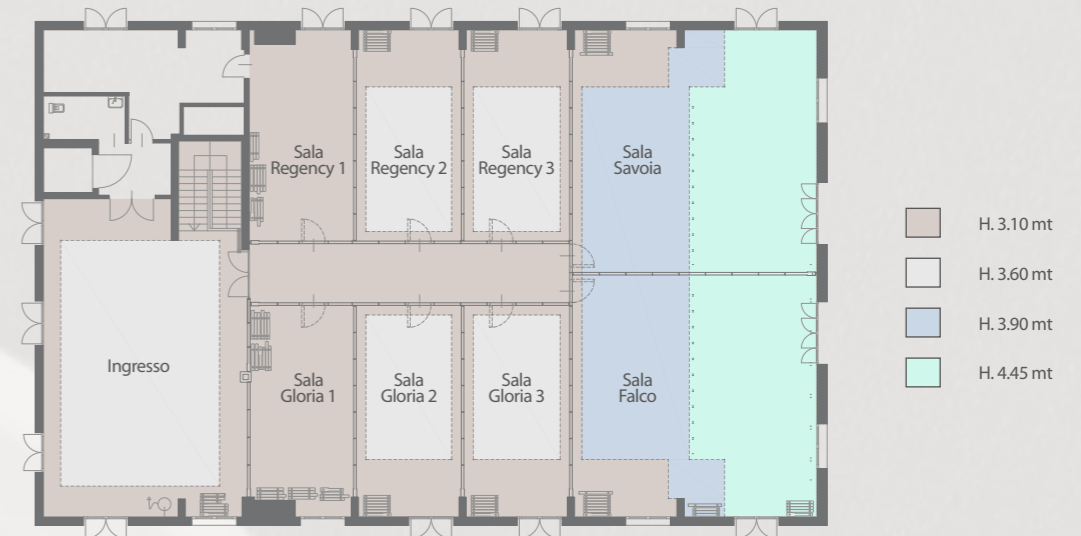
Tabella capienza / capacities